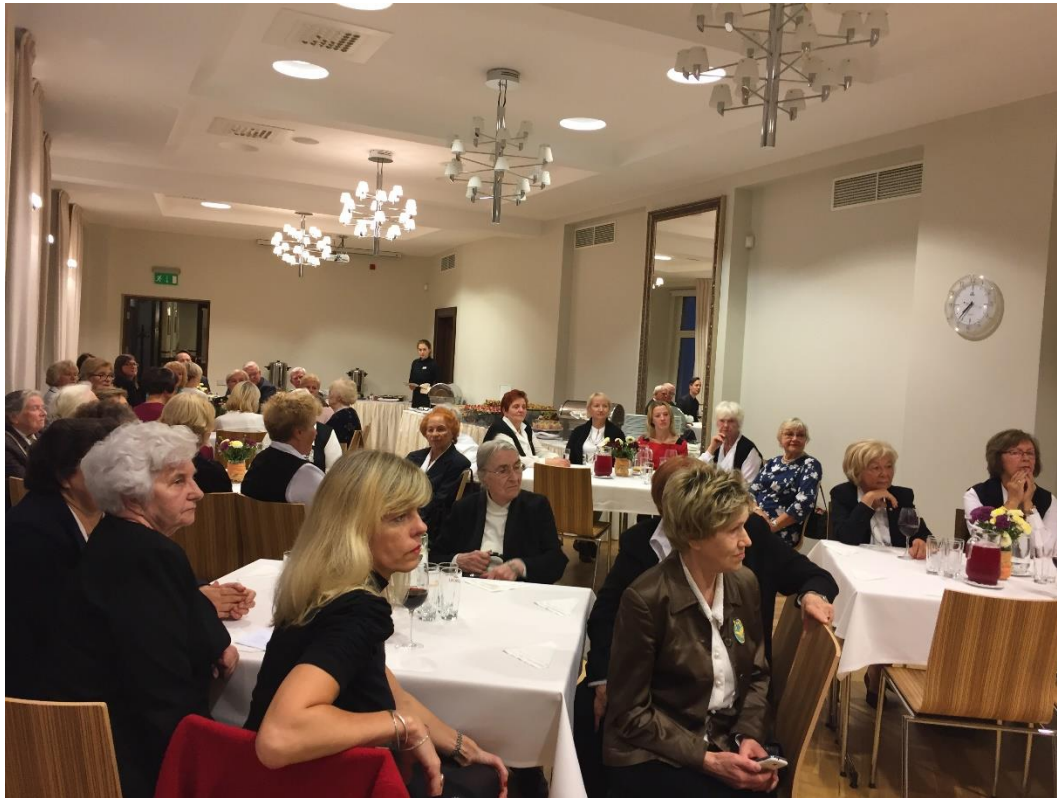
Vanadžu salidojums 2017.gada 22. septembrī