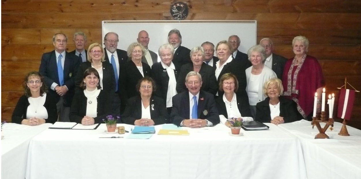
DV ASV un DV Kanādas valdes un viesi

No 2017. gada 8.-10. septembrim mēs kopā ar citiem DV ASV valdes locekļiem un DV Kanādas valdi tikāmies Sidrabenē pārrunāt organizācijai svarīgos jautājumus. Piektdien pa dienu notika DV ASV valdes sēde, bet jau vakarā tika atklāta kopsēde ar Kanādu. Pārsvārā runas bija saistītas ar gatavošanos DV Centrālās valdes sēdei Latvijā.