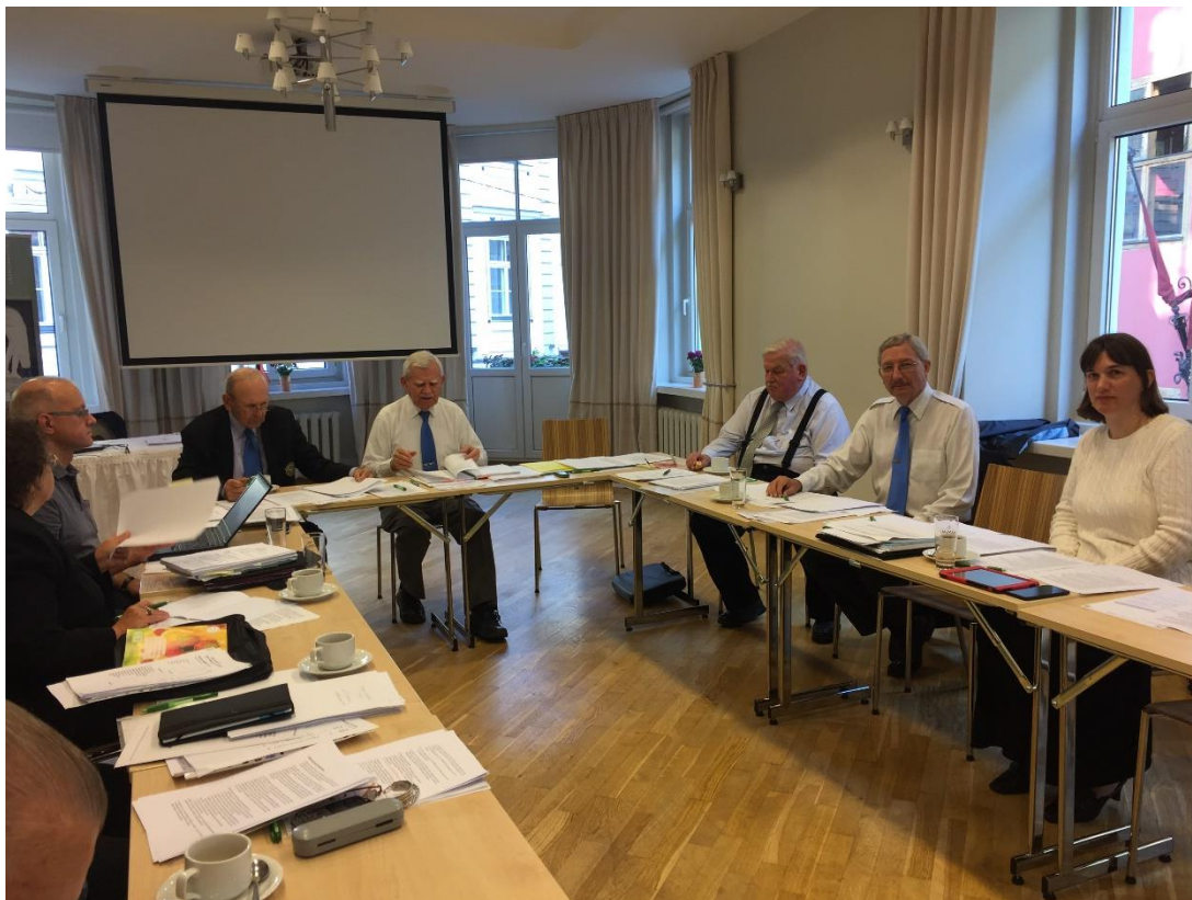
DV CV sēde – 2017. Gada 22. – 24. Septembris